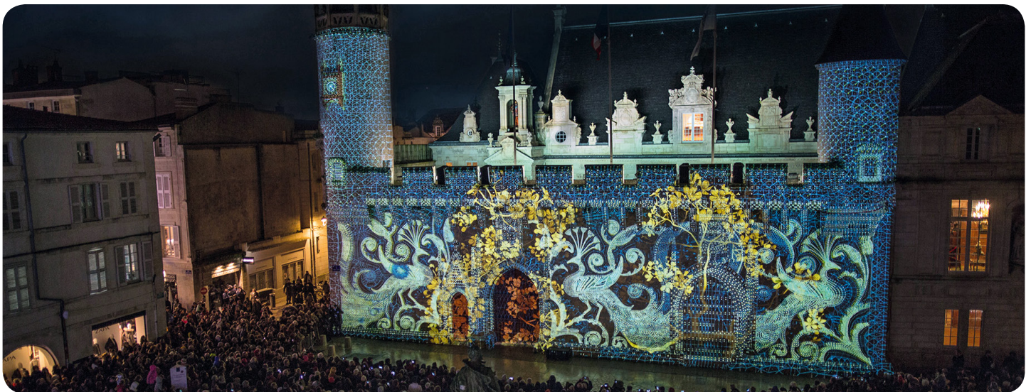
Yann Nguema, Le Sacre du Tympan , 2019 (Hôtel de Ville, La Rochelle, France)