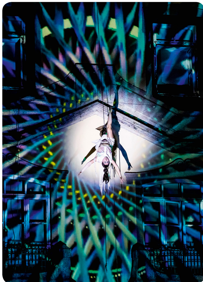
Grandpa's Lab Studio, Moura 2 - Digital Tale , 2019 (Bibliothèque municipale, Chaves, Portugal)