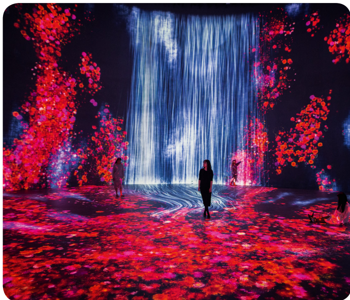
teamLab, Universe of Water Particles in the Tank , 2019 (TANK Shanghai, Chine)