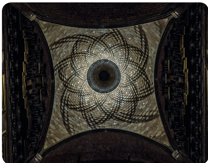
Playmodes, Parabòlic , 2018 (Palais Güell, Barcelone, Espagne)